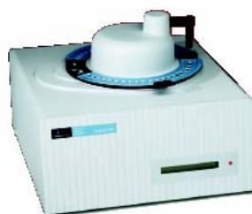
Pyris™ 6 DSC

Недорогой калориметр Pyris 6 DSC предназначен для малобюджетных лабораторий. Прибор сочетает в себе отличные характеристики при невысокой цене. Управление и обработка данных осуществляется с персонального компьютера, оснащённого ПО Pyris™ Thermal Manager . На передней панели калориметра находится ЖК-дисплей, отображающий температуру и состояние прибора – установка, нагрев, охлаждение или изотермический режим.